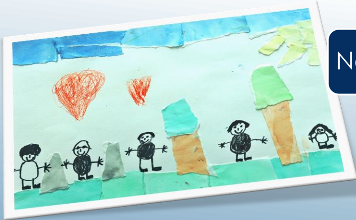
Nele, 7 Jahre